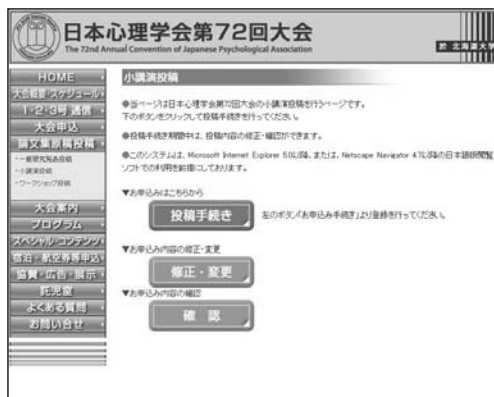
【エントリーページ】